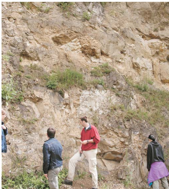
Abb. 1: Exkursionsgruppe im Gemeindesteinbruch

Die Faltung der oberdevonischen Grauwacken und Schiefer erfolgte nach allgemeiner Ansicht während des Oberkarbons. Die im Bruch aufgeschlossenen Zechsteinkonglomerate und auch der Zechsteinkalk (Fortsetzung nebenstehend)