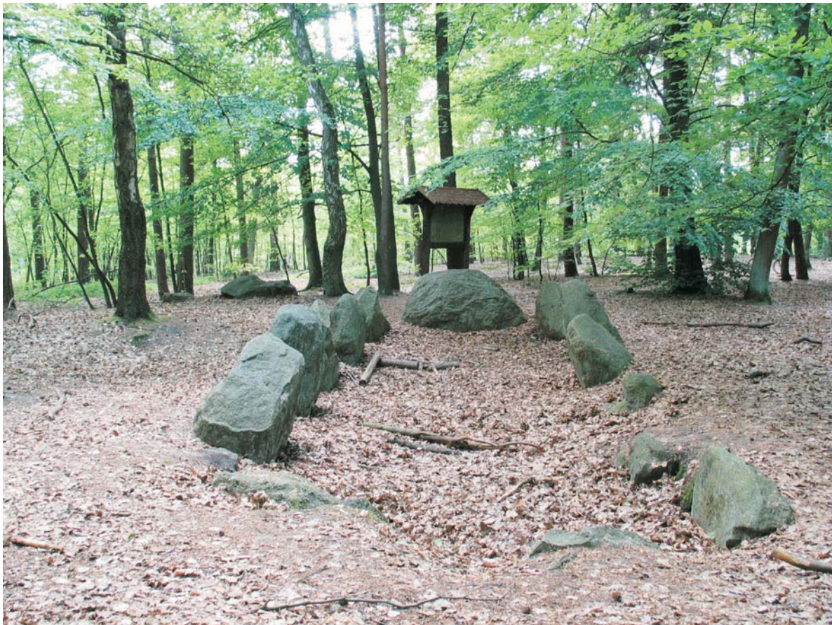
Abb. 2: Jungsteinzeitliches Großsteingrab

www.nlfb.de/geologie/anwendungsgebiete/objektliste-geotope.htm www.tag-des-geotops.de , www.dgg.de , www.geo-top.de , www.geotope.de www.geoakademie.de